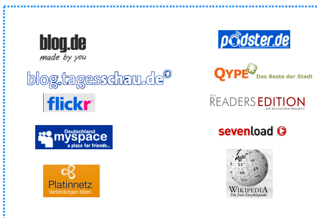
Abbildung 2: Vorgelegte/diskutierte Web 2.0-Applikationen

In Vorbereitung auf unsere Studie wurden die Teilnehmer aufgefordert, sich aus einem Angebot von zehn Websites mit mindestens fünf Seiten näher zu befassen. Intention der Auswahl war es, Beispiele aus den Bereichen Weblogs, Foto- und Videocommunities, Social-Networking, Wiki-Websites und Podcasts diskutieren zu können: